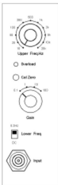
图 1 通道面板